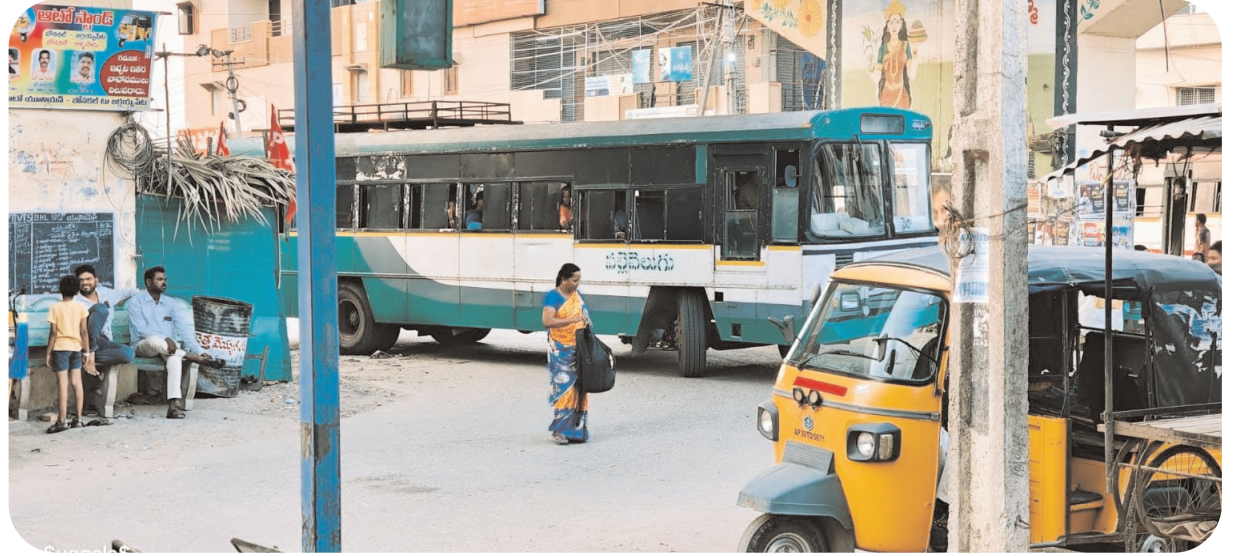
సౌకర్యవంతమైన రవాణా అందించడమే మా లక్ష్యం. మొత్తంగా, గ్రామపంచాయతీ తీసుకున్న ఈ చర్య బోనకల్లో అందుకోసం అందుబాటులో ఉన్న ప్రతి వనరును ఉపయోగించుకుంటూ సమస్యలకు పరిష్కారం చూపుతాం” అని తెలిపారు.

మరియు బ్రిడ్జి చివరగా ఉన్న మరొక కానాను వాహనాలు నిలిపేందుకు ఈ ప్రాంతాలను వాహనాల రాకపోకలకు అనుకూలంగా మార్చి, ప్రత్యామ్నాయ మార్గాలుగా అభివృద్ధి చేయాలని పంచాయతీ యోచిస్తోంది. ఇప్పటికే కొన్ని కాణాల కింద కొంతమంది స్థానికులు సొంత ప్రయోజనాల కోసం అక్కడ ఉన్న చెట్లను క్రమక్రమంగా తొలగించి గేదెలను కట్టివేయడం మరియు వ్యాపారాలు చేసుకోవడం కోసం ఉపయోగించుకుంటున్నారు. అందరికీ ఉపయోగపడే స్థానిక ప్రాంతాలు కొంతమంది మాత్రమే అనుభవిస్తుండడంతో స్థానికులకు తీవ్ర ఇబ్బందులు పడుతున్న విషయాన్ని స్థానిక పంచాయతీ పాలకవర్గం గమనించింది. ఈ చర్యతో ప్రధాన రహదారిపై ఉండే ఒత్తిడి తగ్గి, వాహనదారులకు సులభంగా ప్రయాణం చేసే వీలుంటుందని అధికారులు భావిస్తున్నారు. స్థానిక వ్యాపారులు, ప్రజలు ఈ నిర్ణయాన్ని స్వాగతిస్తూ, ట్రాఫిక్ సమస్యకు దీర్ఘకాలిక పరిష్కారం లభిస్తుందని ఆశాభావం వ్యక్తం చేస్తున్నారు. గ్రామ పంచాయతీ పాలకవర్గం మాట్లాడుతూ, “ప్రజలకు